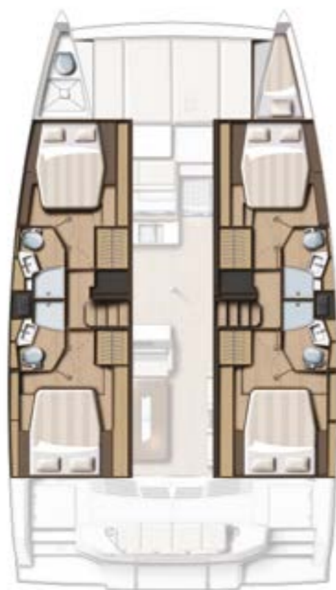
4 CABIN VERSION / 4 BATHS