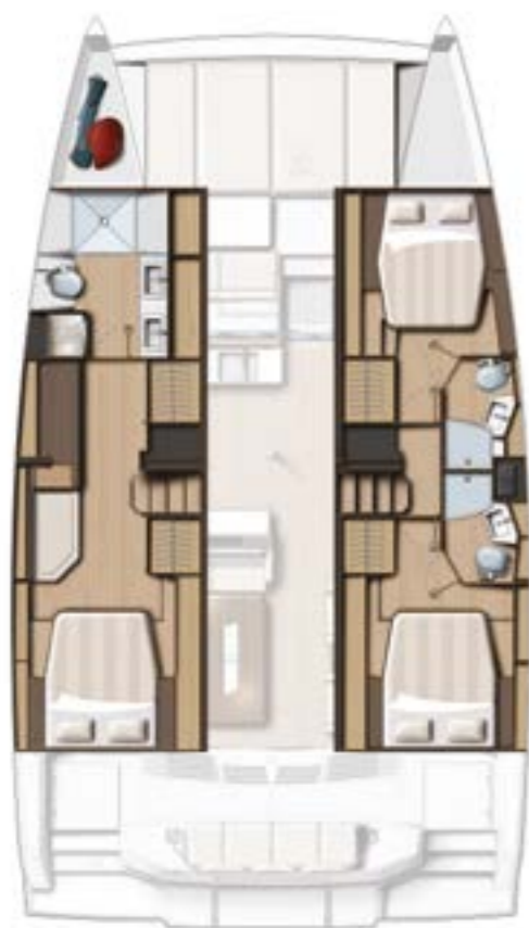
3 CABIN VERSION / 3 BATHS