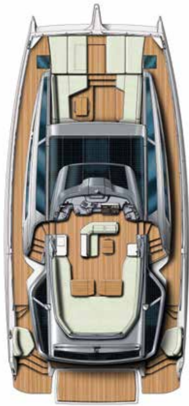
DECK & FLYBRIDGE Pont & Flybridge