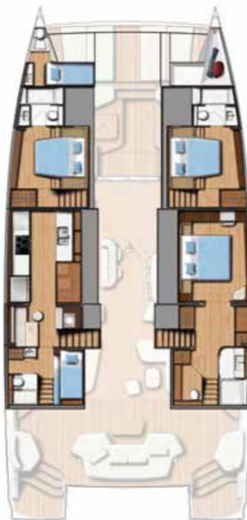
3 DOUBLE CABINS / 3 BATHS (Galley down) Version 3 cabines doubles / 3 sdb (Cuisine en bas)