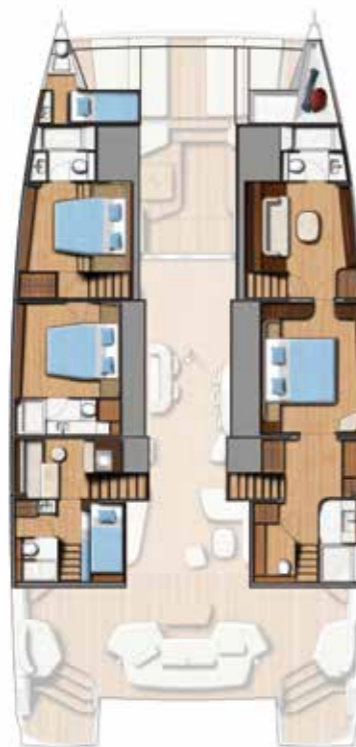
3 DOUBLE CABINS / 3 BATHS (Galley up) Version 3 cabines doubles / 3 sdb (Cuisine en haut)