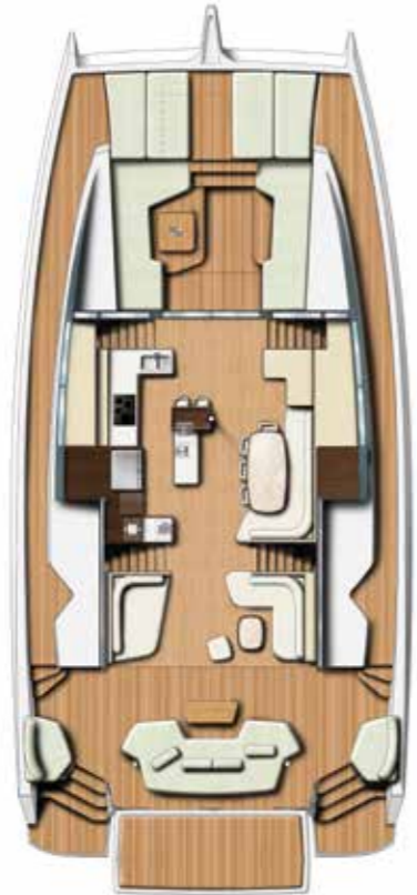
NACELLE with galley Nacelle avec cuisine