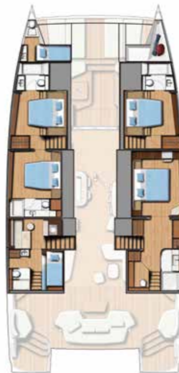
4 DOUBLE CABINS / 4 BATHS (Galley up) Version 4 cabines doubles / 4 sdb (cuisine en haut)

“With the BALI 7.0, we have tried to showcase all of CATANAGROUP’s expertise, combining the heritage of CATANA’s offshore performance with BALI’s innovation and pragmatism, while also crossing the threshold into the luxury market.”