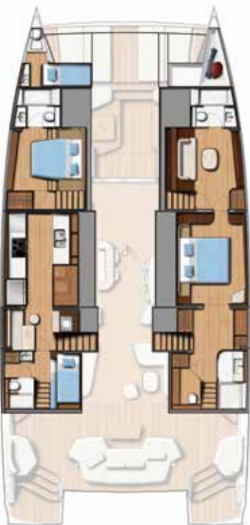
2 DOUBLE CABINS / 2 BATHS (Galley down) Version 2 cabines doubles / 2 sdb (Cuisine en bas)