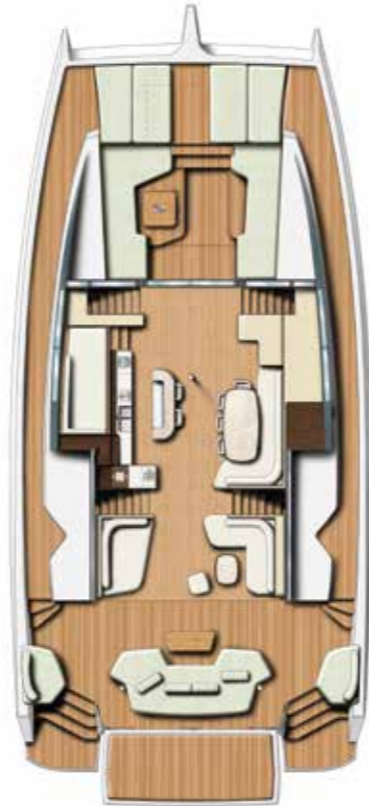
NACELLE with bar Nacelle avec bar